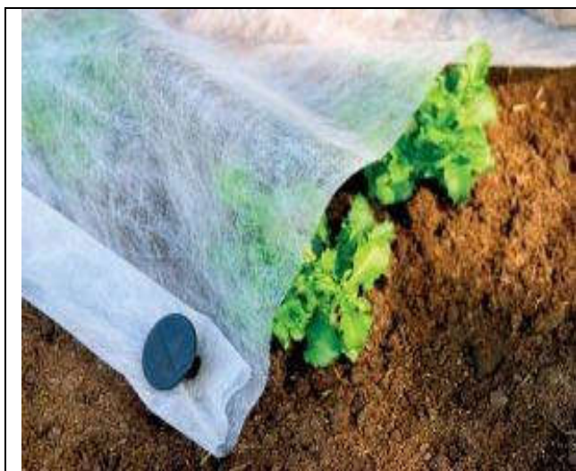
Tessuto non tessuto

E' formato da una membrana di teflon, tra due strati di tessuto sintetico. Lo strato interno assorbe il sudore senza impregnarsi, lo strato di mezzo regola la temperatura e lo strato esterno garantisce la traspirazione del vapore acqueo formatosi e al contempo blocca l'acqua liquida.